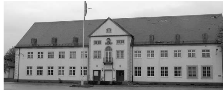
Kommandantur auf dem Sheridangelände

Als im Oktober 2006 die Grün- und Freiraumplanung für den Park im Sheridangelände vorgestellt wird, findet diese sofort breiten Zuspruch. Besonders begrüßt wird, dass die Bedürfnisse der jugendlichen Nutzer genauso berücksichtigt werden wie die der Senioren, Kinder und Familien. Für Jugendliche sollen auf dem Appellplatz vor der zentralen Kommandantur Spielmöglichkeiten geschaffen, die Sporthalle der Amerikaner einer möglichst offenen Nutzung zugeführt werden. Dies alles ist zentral in Nachbarschaft der Schule und auch die Kommandantur erhält durch eine Kirchengemeinde eine neue Nutzung.