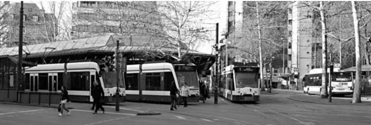
Der Königsplatz ist Kernstück der Mobilitätsdrehscheibe

Auch 2007 sind Verkehrspolitik und die Entwicklung der Innenstadt die Hauptthemen, mit denen sich der Zusammenschluss der Augsburger Bürgerinitiativen und Umweltverbände beschäftigt. In der Unterstützung des Bürgerentscheides für eine Neuplanung des Königsplatzes sieht man die Möglichkeit ein Nachdenken über eine bessere Verkehrspolitik zu erreichen. Mit Bedauern wird zur Kenntnis genommen, dass der Wahlkampf dieses Nachdenken verhindert.