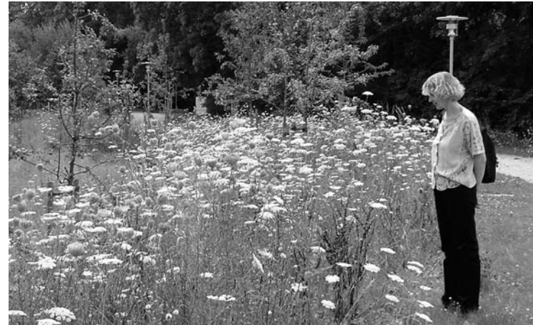
Biotop am Hennigbach

Als gekonntes Beispiel dieser Strategie wird den Besuchern von der Wertach der „Unterbräu“ gezeigt. Aus