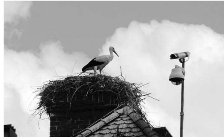
Das Storchennest auf dem Schulhaus