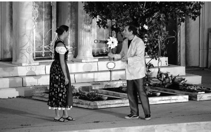
Markt Schwabener Weierfestspiele: Das Paradies ist überall...

Am Abend schließlich besuchen wir die Weierfestspiele, wo wir uns köstlich an dem viel Spielwitz vortragenen Spektakel ergötzen. Beeindruckt von der aktiven Marktgemeinde, die mit gut 11.000 Einwohnern etwa halb so groß wie Pfersee ist, machen wir uns Tags drauf mit Bahn und Rad auf den Nachhauseweg und fragen uns, ob es uns nicht auch gelingen könnte, Pfersee zu einem Paradies zu machen.