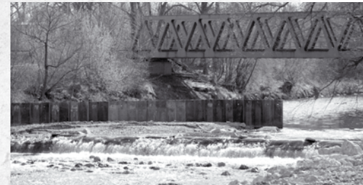
Mühlbach-Düker an der „Eisernen Brücke“

Hierzu wird von den angrenzenden Privatgrundstücken ein ca. 5m breiter Streifen benötigt. Der Bau soll im Herbst/Winter 2008 erfolgen.