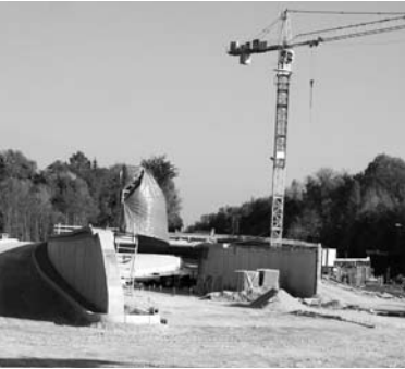
Umbau der B17-Kreuzung Gabelsberger Straße

In der Regel berichten wir in unserem Jahresbericht ja über unsere Aktivitäten, daher sei hier einmal erläutert, warum wir uns in diese Diskussion öffentlich nicht mehr eingebracht haben. In unserem letztjährigen Bericht haben wir bereits zur geplanten Absenkung der Fahrbahnen an der Kreuzung Leitershofer Straße/ B17 unter den regelmäßigen