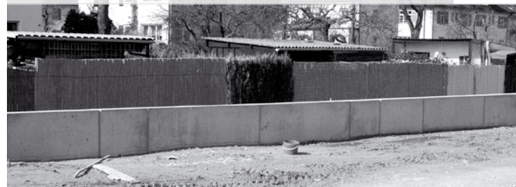
Hochwasserschutzmauer in Bau

Im Bau ist der 2. Realisierungsabschnitt südlich des Gollwitzersteges bis zur Localbahnbrücke. Um das Hochwasserschutzziel zu erreichen ist auf der Ostseite der Localbahntrasse eine Schutzmauer notwendig, die zur Kleingartenanlage Lutzstraße hin angeböschet wird. Die Zugänge können bei Hochwasser mit Balken, die in einer Kiste vor Ort lagern, geschlossen werden. Damit sich die Wertach nicht weiter eintieft, wird die Flusssohle durch Querriegel stabilisiert. Unterhalb des Mühlbachdükers ist eine ca. 30 m lange Steinrampe vorgesehen. Eine Uferaufweitung, wie südlich der Gögginger Brücke, scheitert daran, dass Localbahntrasse